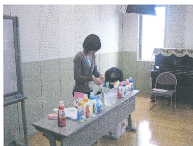
水に溶かしたセフターEと蛍光材入りの市販品にブラックライトを当てる実験。蛍光材入りは青白く光ります。