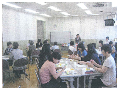
環境に優しい洗剤とは？ すすぎ1回の洗剤って本当に大丈夫？などなど、皆さん熱心に勉強されています。