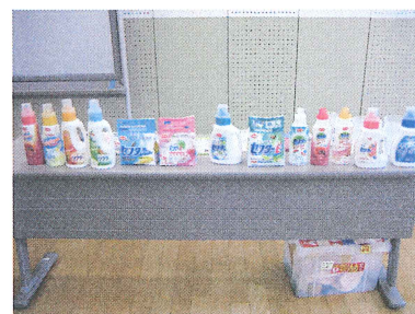
それぞれの製品の特徴を聞いた後、柔軟材の香りを実際に確かめて、自分に合った洗剤を知ることができました。