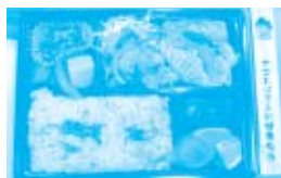
出雲支所のくらしづくり委員会考案メニューの「あるもんで弁当」は大好評でした。