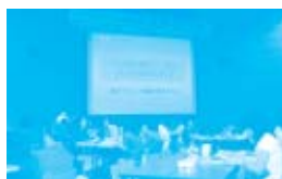
アットホームな雰囲気の中、メッセージ交流が行われました。

6月12日、松江市のくにびきメッセにて第22回通常総代会が開催されました。191名の組合員総代会が出席し、第1号から第5号までの議案の採決を行ない、すべての議案が可決されました。コープネット開発商品が置かれたテーブルを囲み、対面式で着席する機の配置になっており、アットホームな雰囲気です。総代会は進められました。総代、メーカー、職員が登場してのインタビューや、毎日の暮らしの中で感じていることや伝えたいことを発表するメッセージ交流なども行なわれ、「生協と共に私も(家族も)一緒に成長していきたいら...そんな想いの1日でした」などの感想が寄せられました。総代会終了後は、すべてコープ商品を使って作る生協しまね総代会名物、コープ弁当「あるもんで弁当」が配られ、大変好評でした。