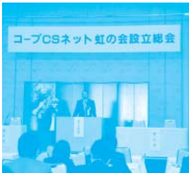
同会場で行われた「コープCSネット虹の会設立総会」