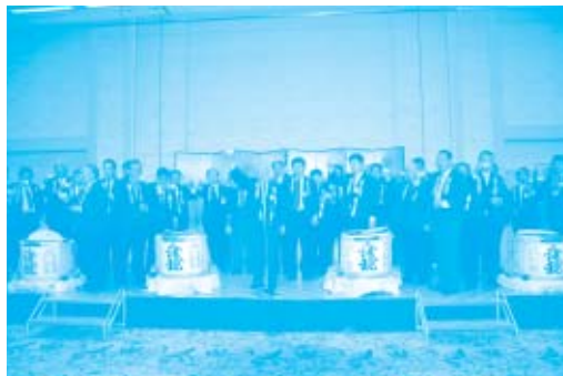
設立総会后、盛大にレセプションが行われました。