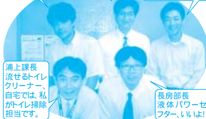
~ 私たちのおすすめ商品です!! ~