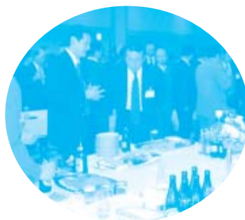
レセプションの様子