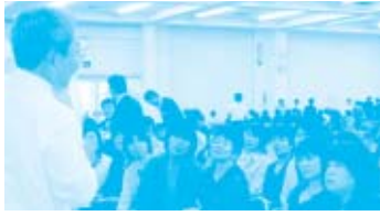
広島 グループに分かれ、各ブースを巡りして学習しました。