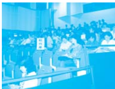
すべての議案が賛成多数で承認されました。