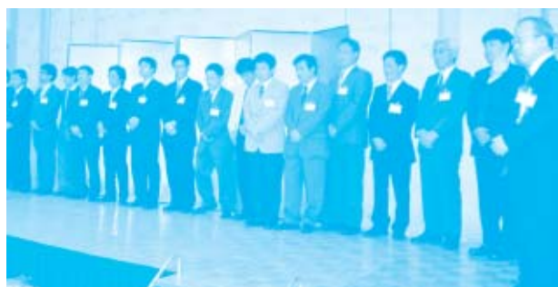
コープCSネット役職員紹介