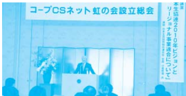
小倉会長による講演