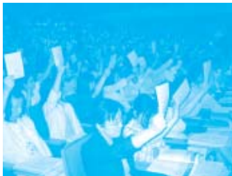
総代499名の参加があり、全ての議案が可決・承認されました。