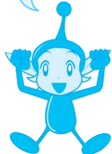
ナビゲーターとして登場する『ココまる君』

料理をする・できることがたいせつ 食をとりまく家庭がたいせつ 食べることがたいせつ 情報を読み解くことがたいせつ 食べ物をつくる現場がたいせつ 食の向こうが見えることがたいせつ