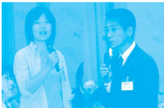
発言を頂いた理事のみなさん