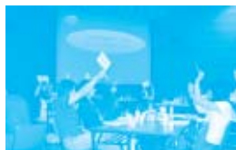
すべての議案が可決され、総代会は無事終了しました。