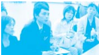
尾道 熱心に質問をする職員。お取引先様にひとつひとつ丁寧に説明していただきました。

6月26日(月)、広島・尾道の両市内の2ヶ所で、職員が商品についての理解を、より深めるために、「生協ひろしま試食学習会」が開催されました。当日は、職員約500名が集結、両会場合わせて29社のお取引先様にお越しいただき、商品の特徴やセルメポイントを説明していただきました。