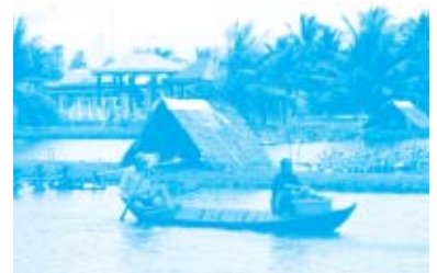
養殖池での給餌風景