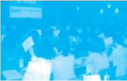
第1号議案採決の様子