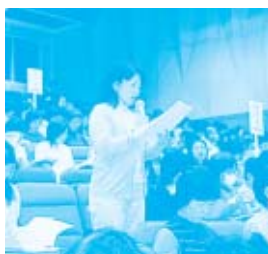
代表して発言する総代さん。