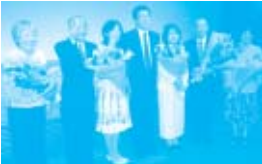
総会後のレセプションにて、選任される女性理事さん達。