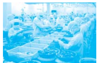
ホーチミンにある加工工場(アマダフーズ)