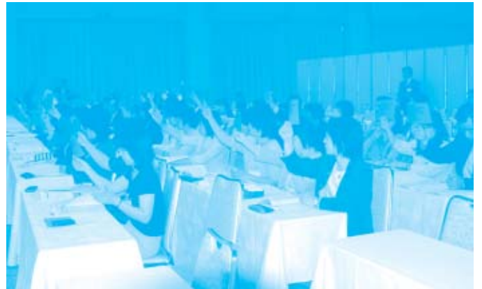
提案されたすべての議案は、圧倒的賛成多数により採択されました。