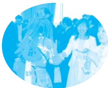
鬼太鼓の鬼と握手をすると1年間健康に過ごせるそうです。