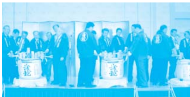
鏡割りが盛大に行われました。