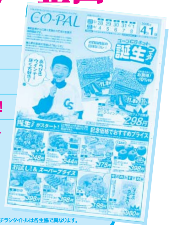
チラシタイトルは各生協で異なります。

コープCSネットでの統一企画がいよいよ4月からスタートしました! 全国では1番最後の事業連合となった「コープCSネット」ですが、好調なスタートを切ることができました。他の事業連合では、スタート時に苦戦するという前例も多い中、各会員生協の協力ときめ細かい組合員対応、誕生フェアの相乗効果により、好成績を残すことができました。会報6ページでまとめを詳しく報告しています。