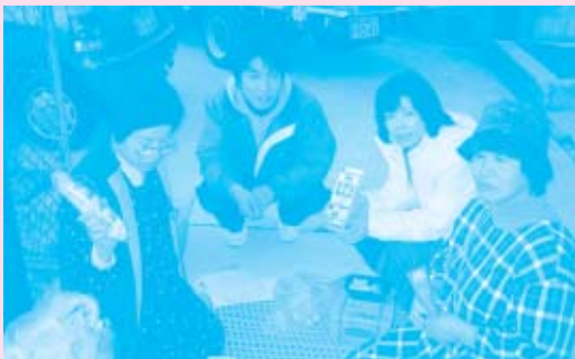
とにかく安さが魅力の『コープ牛乳』は、賞味期限も長く、開発商品の中でも大人気商品です。(おかやまコープ 津高センター)

「コープッキング、旬の食材を使ったメニューが多いのでうれしい。見ているだけでレパートリーが増えた気がする」 「ふあみゆ、孫幼児へのおやつを選ぶ幅が広がった。原材料表示が詳しくされているのでアレルギーには助かる」