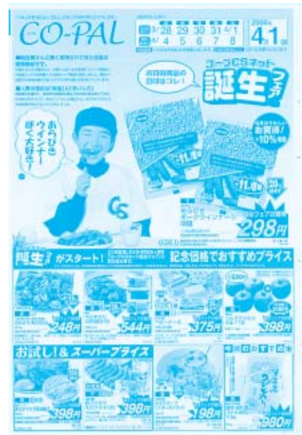
チラシタイトルは各生協で異なります