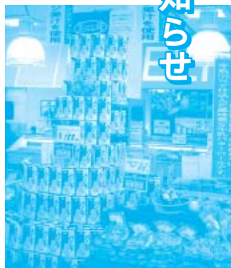
牛乳、タイロルとハンシアオレンジジュースの陳列(コープ西大寺・岡山市西大寺) お買い物中の組合員さんからは、「安いなあ」、「美味しそうなりげじやな」という声も。

4月、おかもコープでは、店舗でのCSネット共同開発商品とクオリティコープ商品の商品販売コンテストを実施しました。各店とも、コンテストに向けて学習会や試食を行いながら、それぞれの商品の良さを伝える売場作りを知恵を絞りました。取り組み期間中は、毎週、数値実績や売場写真を交流し、実績の良い店舗の取り組みの共有化をはかり、水産、デイリー、グロサリー部門でP値の高かった上位3店舗を表彰しました。(この取り組みと同時に、組合員さん向けに、CSネット開発商品とクオリティコープ商品の中から選んだ対象商品のバーコードを集めて応募いただくとプレゼントが当たる。おいしさ実感プレゼント)も行いました。)