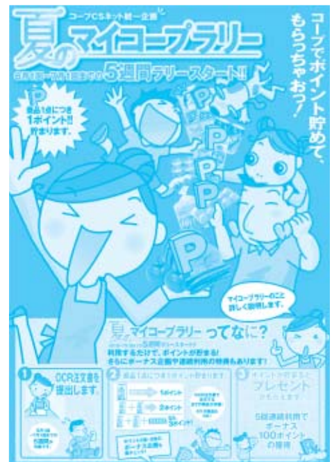
夏のマイコープラリーポスター

尾道支所では、マイコープラリーの取り組み目的として、利用点数UP及び実利用高UPが一緒になった取り組み、春キャンペーンでの新規加入者フォローとして利用定着の取り組み、遊び心、の3点を掲げました。尾道支所平均利用点数は13点であるため、そこから平均獲得ポイントを計算し、どうすれば一人でも多くの方に還元を受けてもらえるかについて、“プレゼントゲットへの道”シュミレーションを作成しました。連続して利用して頂くことが基本ですが、お休みされてしまった方へのアプローチまで細やかな対応を準備しています。マイコープラリーは、供給促進及び利用人数確保といった06年度の重要な取り組みであり、夏・秋・冬の3回行っていきます。そういう意味では「お誘いキャンペーン」「共済キャンペーン」と同様に年間の最重点課題として位置付けており、尾道支所での取り組みが注目されています。