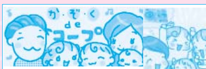
組合員さんの絵日記 絶賛!コープのスープ

そんな「赤サポ会員」の中から、コープさんのお役に立てればと、HPへの「か・ぞ・く de コープ」というイラスト日記や広報誌の「知って安心子育てこんなこと」のイラストなどに協力してくれている若いコープファンの組合員さんも生まれました。やまぐちのデザイン2010のテーマ「食卓に笑顔を!!」のような、ほのぼのした家族の食卓の様子がコープ商品を中心に描かれています。一度のぞいてみてください。 http://www.yamaguti-coop.or.jp/