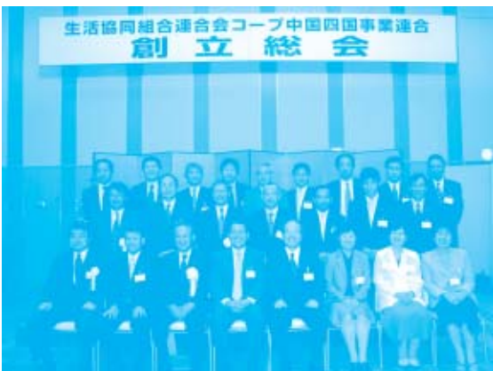
選出されたばかりの理事・監事・事務局も大集合です！ 9生協の気持ちをひとつに・・・！