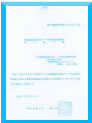
生活協同組合連合会コープ中国四国事業連合 設立許可書

会員生協・ 友誼生協・お 取引先など、 大勢の皆様 の更なるご支 援ご協力を お願いいた します。