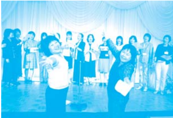
女性理事さん19名による出し物。 「CSネットにや明日がある～」