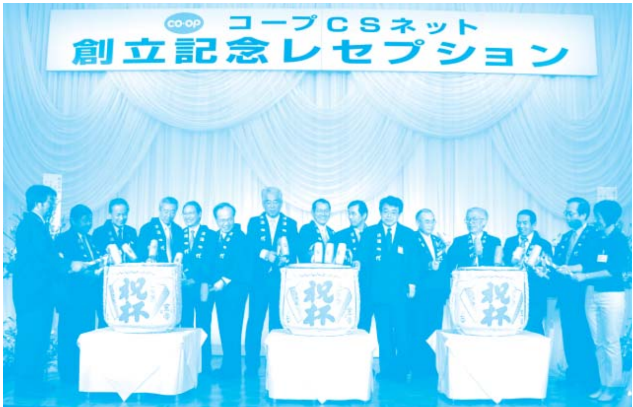
コープCSネットは下記の4つの目的を実現するために、中国四国9生協組合員の期待を受けて新しい一歩を踏み出しました。7月22日、創立総会・創立記念レセプションが開かれ、300名を超える参加者が見守る中、縁起物の鏡割りがおこなわれ、全員で気持ちをひとつに、新しい出発を祝いました。